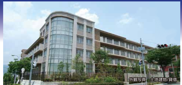
外観写真 土地建物/賃借

少人数のユニットケア方式 24時間365日看護スタッフ (注) 常駐 近隣医療機関とのネットワークで安心の医療支援体制