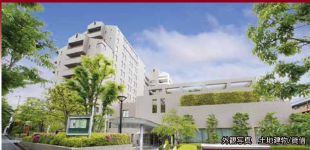
外観写真 土地建物/賃借

ゆとりのある居住空間 専任トレーナーによる健康づくりサービス 緊急時も安心の医療支援体制