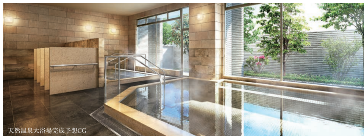
天然温泉大浴場完成予想CG

※1大浴場の温泉は、敷地内の温泉と水中ミネラルで採み上げ、殺菌および温泉付随ガス(タンガス)を分離した後、送湯管から約50m先まで輸送します。また、適宜加温・加水・循環ろ過を行い、適温と水質を維持します。※2スタッフの滞在時間を表記しており、休憩・仮眠時間を含みます。各種サービスの提供時間には限りがございます。緊急対応は24時間行います。※3サービスは個人契約が必要なもの、有料なものがございます。詳しくは係員にお問い合わせください。