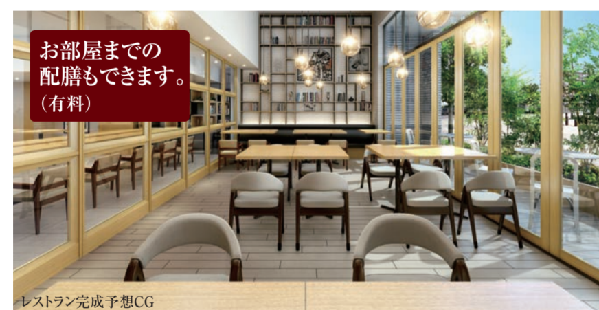
レストラン完成予想CG

4 1階にレストランが併設。食べる、食べないは自由に選択。栄養管理されたヘルシーメニュー。