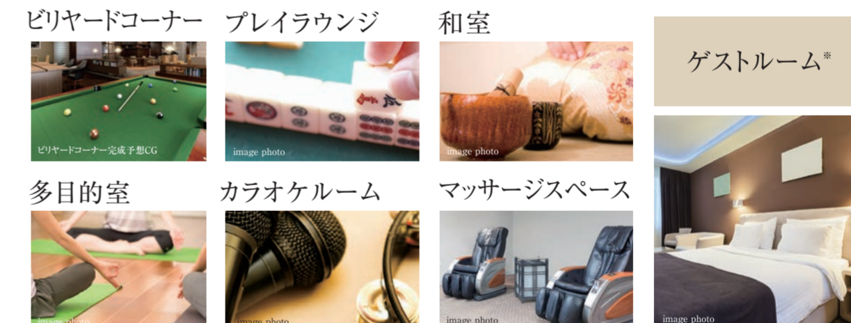
ビリヤードコーナー プレイルounge 和室 ゲストルーム* 多目的室 カラオケルーム マッサージスペース

24時間見守りサービス 介護事業所併設 レストラン併設 天然温泉大浴場 看護師常勤 (日中/8:00~17:00)