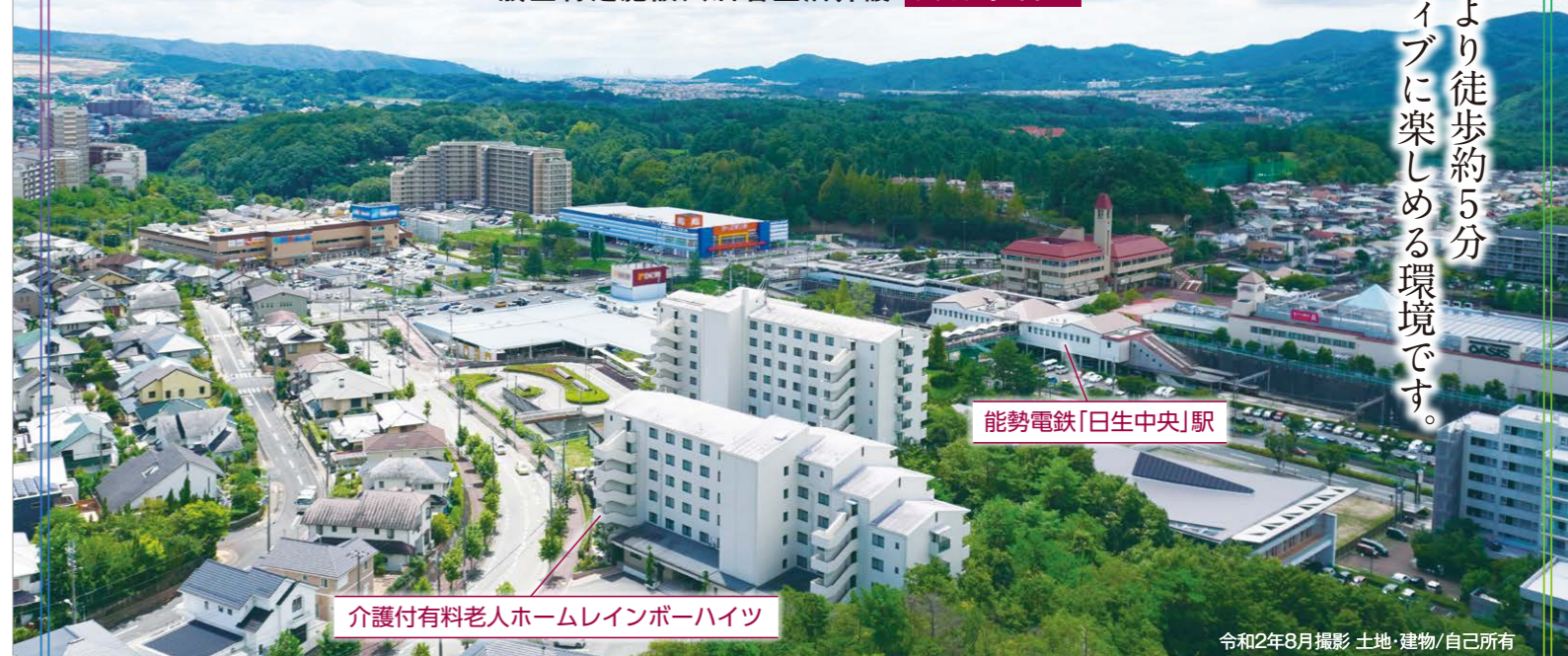
能勢電鉄「日生中央」駅