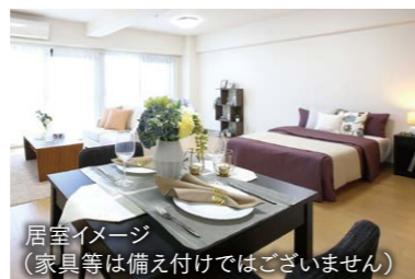
居室イメージ (家具等は備え付けではありません)

日生中央駅から徒歩5分。梅田へも最速40分の快適アクセス。 暮らしに必要な施設がすべて徒歩圏内に揃った、便利で心地よい立地です。館内には体育室やお茶室、娯楽室、カラオケルームなど、多彩な共用スペースをご用意。身体も心もいきいきと過ごせる、アクティブで文化の薫りに満ちた日々をお届けいたします。