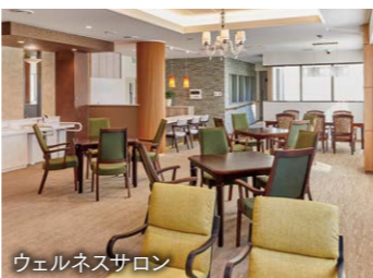
ウェルネスサロン