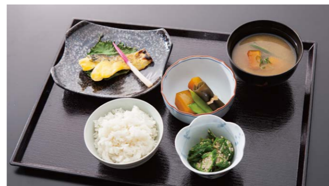
施設選びにはお食事も大切なポイントに。

大きく分けて公共と民間。民間は高齢者向け住宅と有料老人ホームに分類されます。さらに自立型か要介護型か、個別の条件によって選択肢が変わるので、正直、資料だけで判断は難しいと思います。ご自分で調べてみても分かりにくい情報が多いので、やはりプロに相談することをオススメします。セミナー会場は【自立型の介護付有料老人ホーム】で、余談ですけどお食事がとっても美味しいんですよ。中にはシェフが高級ホテルの味を提供するホームもありますが個人的には毎日のことですし、飽きのこない家庭の味が理想だと思います。何度もいただきましたが1回もハズレのないメニューでした。それと、3食を作る時間と労力を他のことに使えるのは人生を楽しむ上でとても重要なんですよ。入居者の中には登山やゴルフ、あとは、麻雀を始めた方もいらっしゃいましたよ。