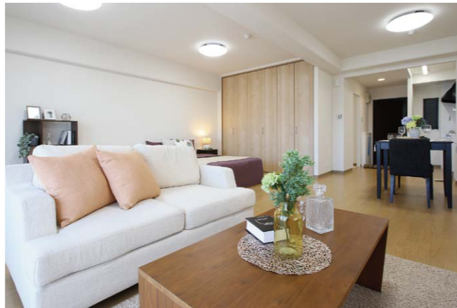
自立型の施設は居室もマンション同様。

まだ自分には関係ない、ピンとこないと言う方がほとんどだと思いますが、実は、新しいライフスタイルを築くには想像以上にエネルギーが必要なんです。理想の環境を手に入れるには情報収集の時間がかかりますし、引越しの負担も大きい。それが体が弱ってからだとどうしても人任せになってしまう。老後と聞くと気分が重くなりますが、人生をより楽しむ準備と考えてください。そのためには自分の目で見て考えて納得することが一番大事だと思います。早くスタートすれば施設を十分に活用することもできますし可能性は広がるばかりで「10年早く来ておけばよかった」という声も多く聞きます。